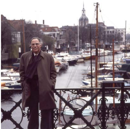
C. Buddingh' op de Nieuwbrug in Dordrecht